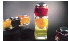
Confiture Citron Orange Pampleousse COMPTOIR DES CONFITURES