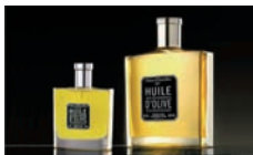
Le Petit et Grand Flacon CHATEAU D'ESTOUBLON