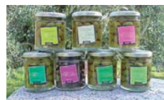
Olives Lucques Natureles et Picholines Aromatisees L'OULIBO