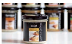
Bulot aux Aromates et aux Petits Oignons