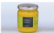
Citron Confit au Gingembre LE COQ NOIR