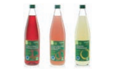
Galavanina Bio Gamme de Sodas Bio DEVEUROP SA