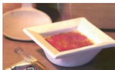
La Crème Flambée SACRE WILLY